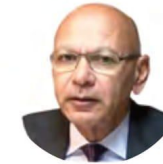
Лес Хан, глава Управления по вопросам инвестиционно- го гражданства Сент-Китс и Невис.

Банки на Карибах работают в обычном режиме, так что можно, собственно, оплатить все необходимые государственные пошлины для начала процесса. Самая простая опция для выбора – взнос в государственный фонд. На одного человека она составляет 150 000 долларов США. На