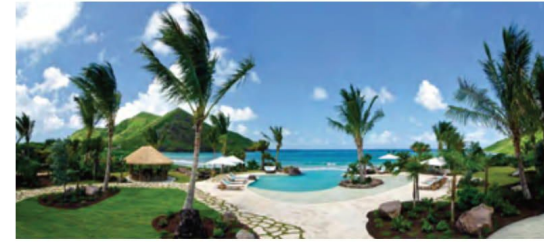
Клуб Pavilion Beach Club