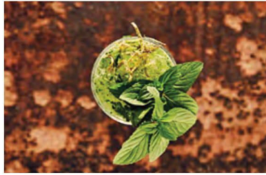
Баре SALT Plage