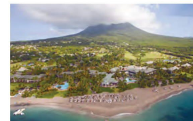
Four Seasons Resort Nevis

Долгое время на Сент-Китс и Невис отелей было мало. В основном это небольшие бутик-отели. Представители местных властей говорили, что строительство новых курортов позволит набрать необходимый минимум в 4000 номеров, чтобы больше развивать туризм и увеличить количество авиарейсов. Это была незанятая ниша для многих отельеров, но реально запустить строительство инфраструктуры помогла программа «Гражданство Сент-Китс за инвестиции». Именно при ее поддержке здесь был построен и открыт в 2017 году Park Hyatt St. Kitts .